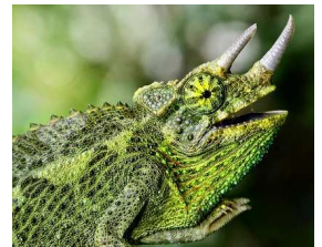
Caméléon de Jackson

Il se nourrit de proies vivantes dans un récipient à bords relevés auquel mon Caméléon accède par une branche. En plusieurs repas, j'apporte une 20 aine d'insectes chitineux par jour (juvénile) à une 10 aine tous les 2 jours (adulte). Ils sont variés et de taille modérée (grillons, blattes, sauterelles, criquets, mouches...). Riches en graisses, je ne donne des insectes vermiformes qu'une fois par semaine : vers de farine, vers à soie, larves de morios, teignes de ruche, etc. J'évite lucioles, chenilles et papillons, à potentiel toxique. Stockés dans un récipient fermé mais aéré contenant litière et carton à œufs, les insectes sont nourris au moins 48h avant de les donner à manger. Je les nourris au gruu pour grillons, granulés pour Lapin, croquettes pour chat, fruits (baies, orange, figue, papaye) et/ou légumes/végétaux (endive, salade sauf laitue, pissenlit, chou, brocolis, radis, épinard, céleri, fenouil, trèfle blanc, luzerne). Je les hydrate avec de l'eau gélifiée pour insectes ou un morceau d'éponge régulièrement imbibé. Avant de les donner, je mets les insectes dans un sac contenant de la poudre de calcium seule que je secoue afin de les saupoudrer. A donner 2 fois par semaine, les vitamines ne sont utiles que si le Caméléon est carencé ou malade.