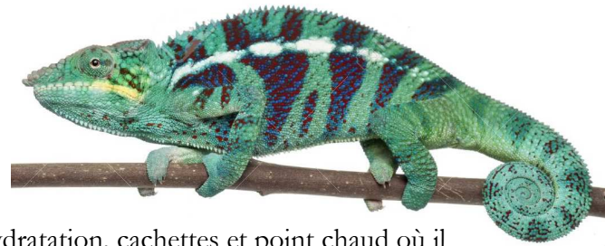
Caméléon léopard ou Pardalis

Ainsi, les parcours créés desservent sites alimentaire, d'hydratation, cachettes et point chaud où il lézarde sur des branches horizontales. Les structures sont renouvelées si détériorées ou mangées.