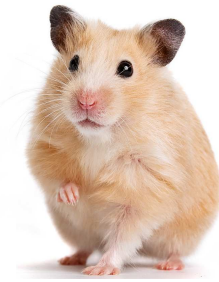
Hamster doré >