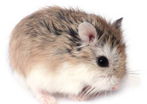
Hamster de Roborovski