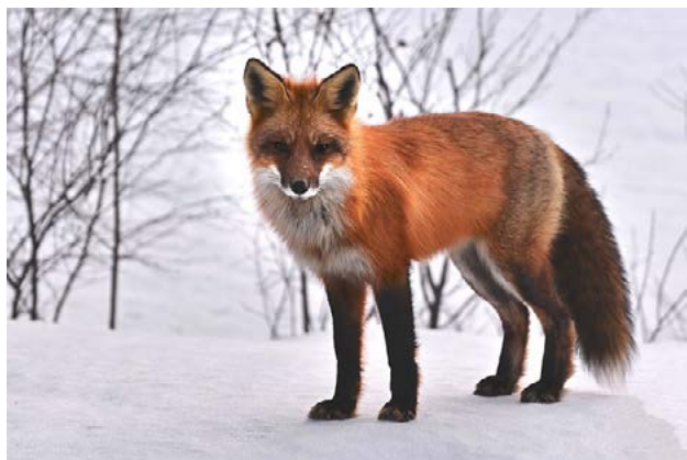
Renard par Alain Audet de Pixabay

Ceci a été rendu possible grâce à la vaccination orale des renards qui constituait le réservoir du virus de la rage en France et en Europe de l'Ouest.