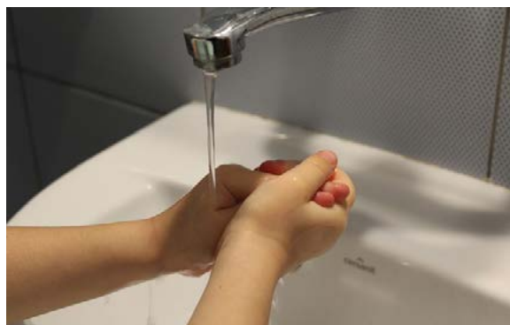
Le lavage des mains : une mesure essentielle de prévention

Du fait de leur promiscuité avec les animaux domestiques (notamment les jeunes animaux), les enfants sont plus exposés à d'autres dangers (par transmission oro-fécale), en plus des nombreux parasites (voir Zoonoses 2), à l'exemple de la pseudotuberculose (qui mime une crise d'appendicite) ou de la campylobactériose (diarrhée auto-limitante). Il est important de bien insister sur le lavage des mains au savon après toute manipulation des chiens et des chats.