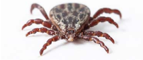
La tique : parasite vecteur de la maladie de Lyme

D'autres maladies communes à l'homme et à l'animal, en revanche, ne sont pas directement transmises par le chien ; par exemple la borréliose, ou maladie de Lyme, Il s'agit d'une infection contractée par une piqûre de tique porteuse des Borrelia , sans passage du chien à l'homme.