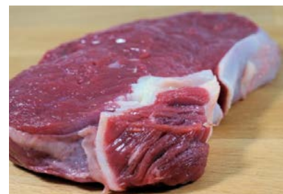
Attention à la viande crue !

A noter enfin que les rations à base de viande crue et d'os (régime « BARF* ») peuvent être à l'origine d'infections (souvent des toxi-infections) chez la personne préparant ces rations en raison de la mauvaise qualité bactériologique de certaines viandes crues.